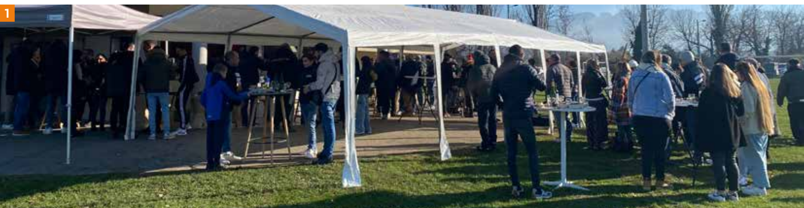
Amateurs de fruits de mer et passionnés de football se sont réunis pour une matinée mémorable.