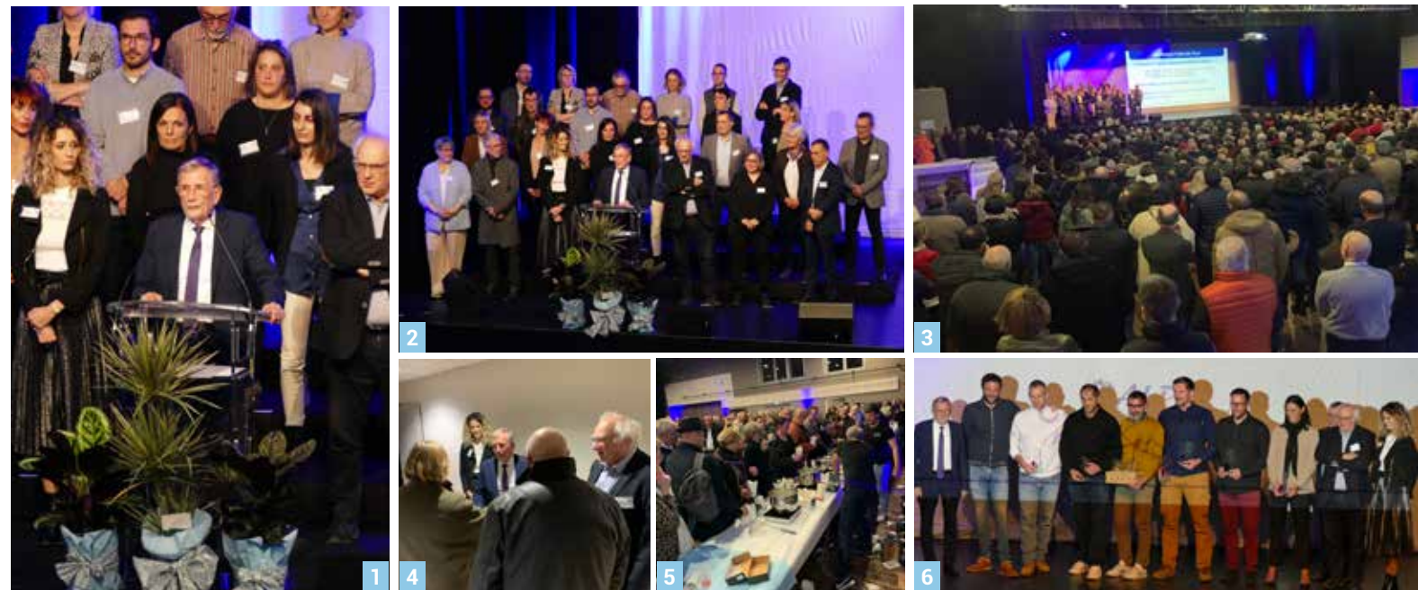
Un beau moment de partage et de convivialité